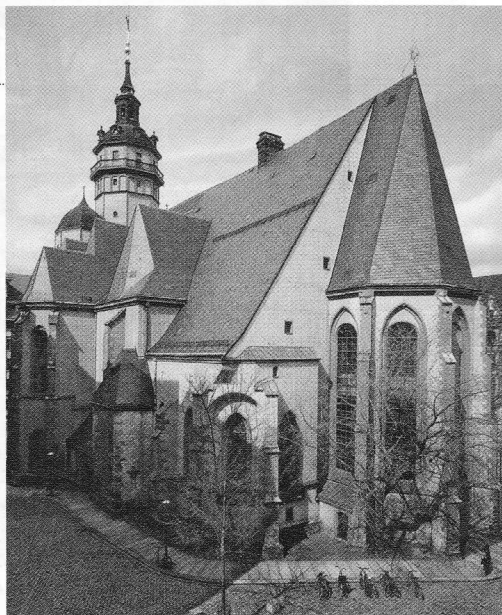
Thomaskerk in Leipzig