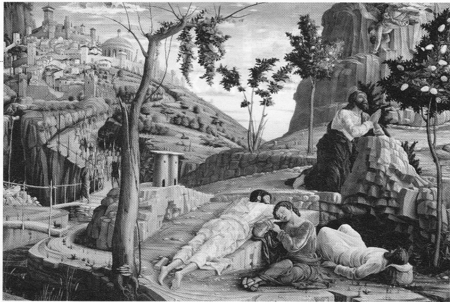
Jezus bidt in Gethsemane, Andrea Mantegna, 1470

passie extra kracht bij met dubbel koor en orkest, dus op 11 april 1727 was het voor de zangers en spelers dringen op het orgelbalkon. De kerk was traditiegetrouw vast goed gevuld, maar wat men hoorde was ongehoord. De Matthäus-Passion bestaat uit twee delen, oorspronkelijk in de eredienst uitgevoerd vóór respectievelijk na de preek.